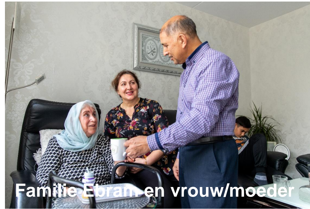
Familie Ebram en vrouw/moeder